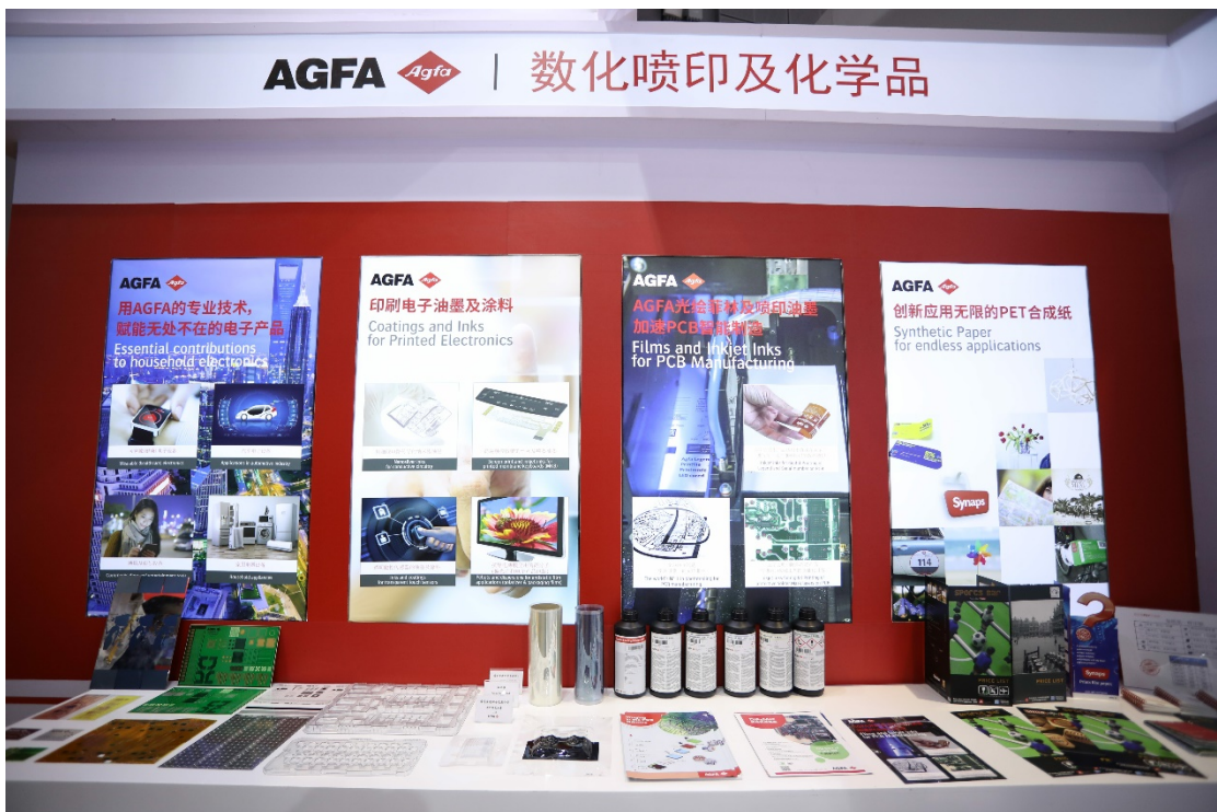
爱克发在第二届进博会展示数化喷印及化学品系列产品

数化喷印及化学品事业部则重点展示了 Inkjet Ink 喷印油墨、Orgacon 导电高分子、PCB Film 菲林，以及 SYNAPS 合成纸。